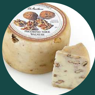
Brânză pecorino cu nuci