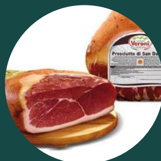
Prosciutto crudo San Daniele