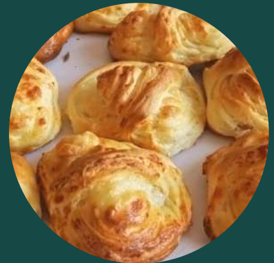
Coșulețe brânză/șuncă + cașcaval