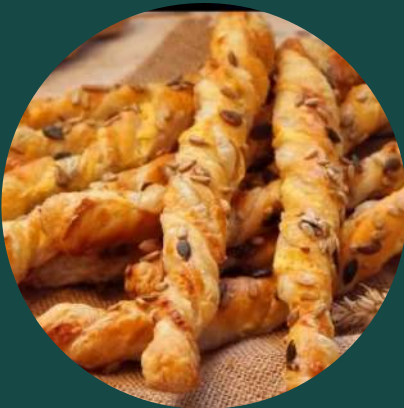
Împletituri bacon/ cașcaval