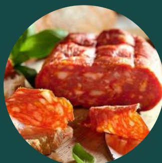
Salam picant spianata Romana