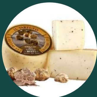
Brânză pecorino Moliterno cu tartufo