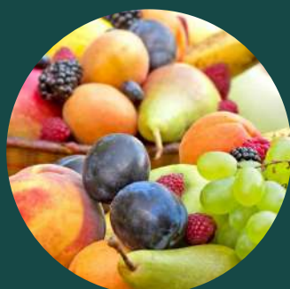
Fructe proaspete de sezon