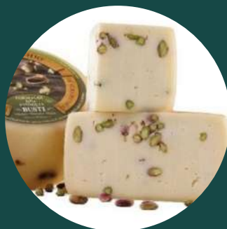
Brânză pecorino cu fistic