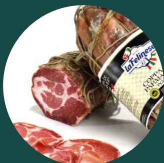
Coppa di Parma