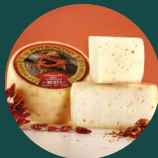
Brânză pecorino cu chilli