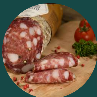
Salam Premio Gusto